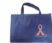
不織布バッグ(ネイビー)