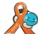
ピンバッチ(くろしおくん)