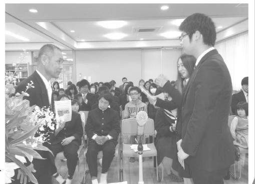
卒園式でのお祝い金贈呈 ▶