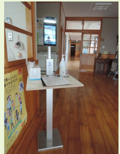
玄関での検温・消毒に御協力を 若草園では来園者の皆様にコロナ感染対策の一環として体温測定と手指消毒をお願いしております。ライオンズクラブ様より自動検温機が寄贈されました。