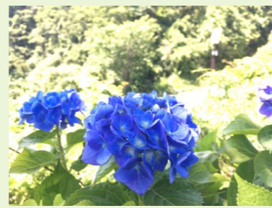
アジサイが咲いた 今年も園庭のアジサイが色とりどりに咲きました。