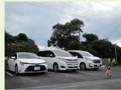
各ホームにマイカーが来た 本園では各ホームが車を共用していましたが、今年度からは各ホームで専用の車を持ちました。それぞれが車選びからはじまり4月までに納車されました。