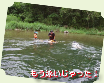
もう泳いじやった!