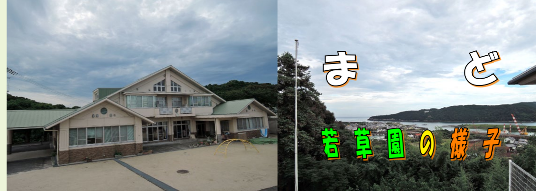
5.19 ころ 四国地方が梅雨入り 曇り空の若草園本園建物とCホームからの四万十川河口の眺め。