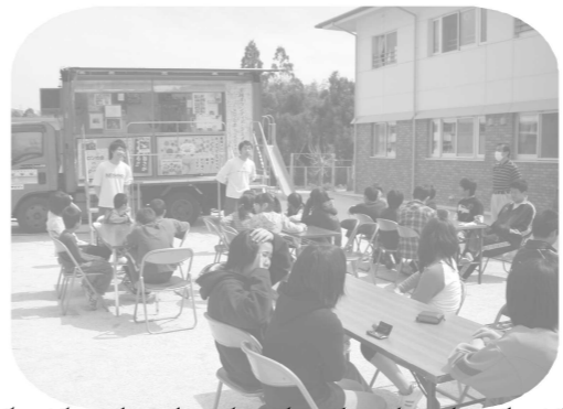
3/21 ラーメン屋台来訪 メロンの会主催の全国ボランティア・ラーメンキャラバンで食べ放題の出前がやってきました。