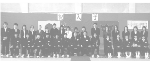
4/7 下田中学校入学式