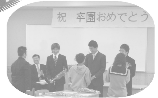
3/15 若草園卒園式 高校卒業した2名が就職、中学卒業した1名が進学のため、園を巣立っていきました。