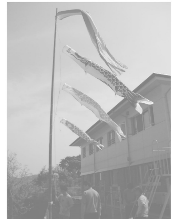
4/18 こいのぼり据付 男性指導員が力をあわせて、新しい園舎でも泳がせました。